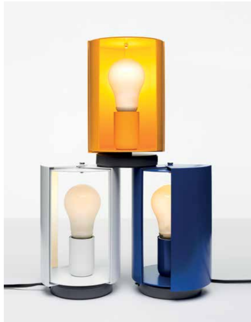
PIVOTANTE À POSER WHITE, YELLOW AND BLUE