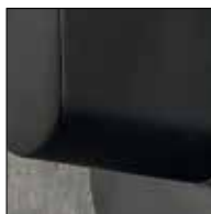
NE: Nero opaco/ Matt Black