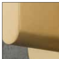
OR: Oro opaco/ Matt Gold