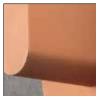
RA: Rame opaco/ Matt copper