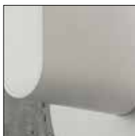
BI: Bianco opaco/ Matt White